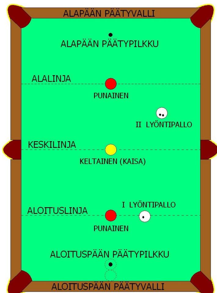
Kuva (esimerkki aloitustilanteesta)